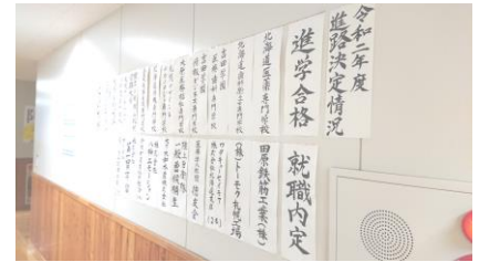
↑新しいステージへ向けての出発準備！

雪で道が狭くなっていたり、歩道が無いところもあるかもしれません。登下校は気をつけてください。また、バスも遅れがち。時間に余裕を持って、登校しましょう。