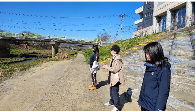
3/22 河原で腹式呼吸の練習