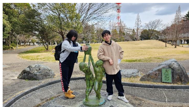
会場前の公演で記念撮影①