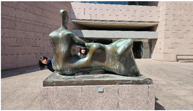
3/24 いわき市美術館で現代アートを鑑賞