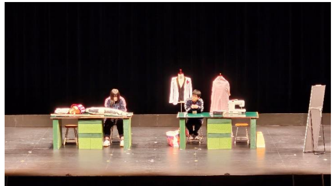
素晴らしいホールでしっかり練習