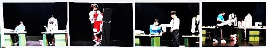
大会でいただいたメッセージと写真を部室に飾りました

たくさんの方にご支援、ご協力、応援いただきました。本当にありがとうございました！