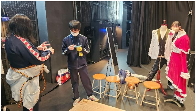
緊張のリハーサル直前