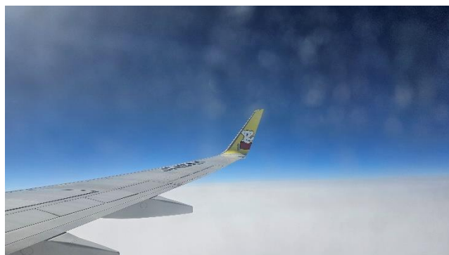
ついに北海道を出発