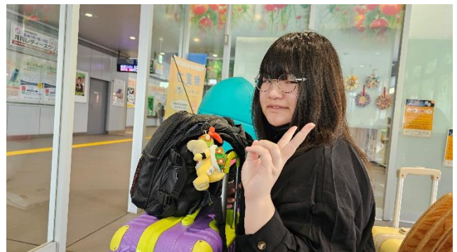
3/25 いわき駅にて ありがとういわき