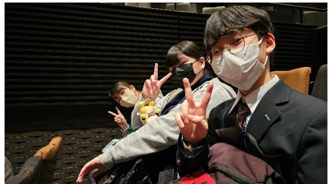
いよいよ始まります！