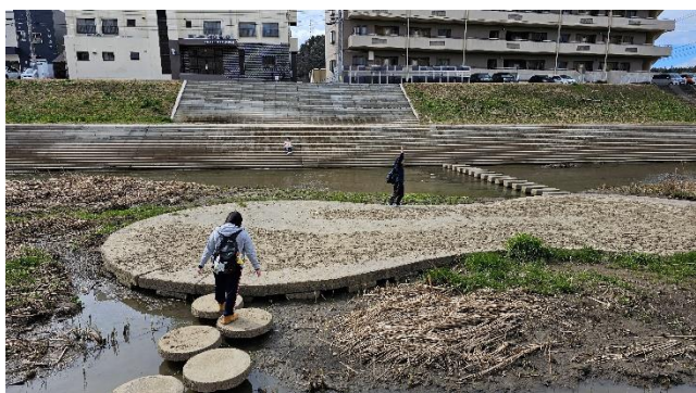
会場横の河原を散策