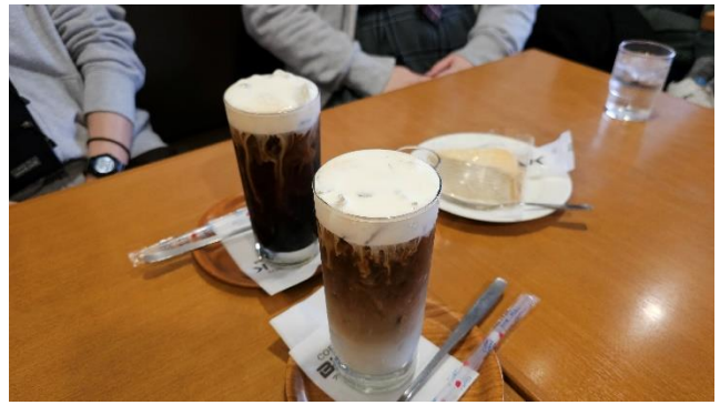
ホテルの方お勧めのカフェで反省会