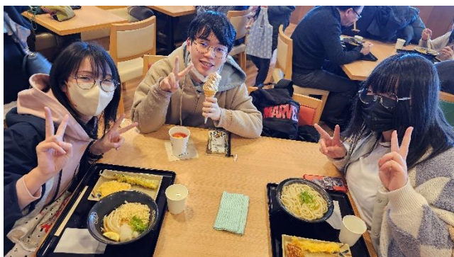
3/20 新千歳空港で昼食