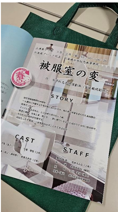
楽屋にて パンフレット